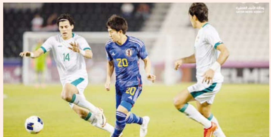
لاعب اليابان يمر من لاعب العراق

تأهل منتخب اليابان وأوزبكستان إلى أولمبياد باريس 2024 بعد وصولهما إلى النهائي ببطولة كأس آسيا تحت 23 عاماً لكرة القدم المقامة في العاصمة القطرية الدوحة. واستطاعت اليابان تجاوز العراق بهدفين نظيفين في المباراة التي أقيمت على استاد (جاسم بن حمد) فيما انتصرت أوزبكستان على اندونيسيا بذات النتيجة في مباراة أقيمت على استاد (عبدالله بن خليفة).