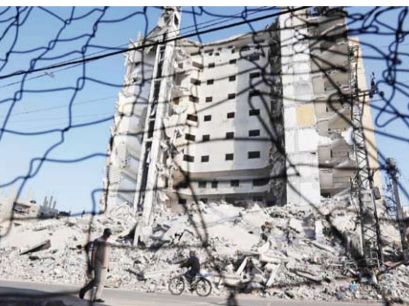
فلسطيني يمر بجانب مبنى مدمر في رفح

أعلن مصدر مطلع على مفاوضات التهدئة وتبادل المحتجزين بين حركة «حماس» وإسرائيل أن صفقة بين الطرفين باتت وشيكة وقد يتم التوصل إليها خلال بضعة أيام إذا تم الانتهاء سريعاً من بعض الإشكاليات التي تعيق التنفيذ، بحسب وكالة أنباء العالم العربي. وكشف المصدر المقرب من الوسطاء للوكالة، أن المقترح المصري يحظى بقبول لدى الطرفين، إلا أن الإشكالية تتعلق في عدد المحتجزين لدى حركة «حماس» من الفئة العمرية والطبيعة الوظيفية المطلوب الإفراج عنهم ضمن المقترح. وكانت حركة «حماس»، قالت سابقاً إنها استطاعت حصر 20 محتجزاً من كبار السن والمرضى والنساء، بينما يطالب الإسرائيليون بإطلاق سراح ما بين 35 و40 محتجزاً. وقال المصدر: «هذه العقبة يمكن تجاوزها من خلال عدد أيام التهدئة التي يمكن التوافق عليها، حيث إن المطروح 6 أسابيع وقد يتم تقليص هذه الأيام إذا لم تتمكن (حماس) من إطلاق سراح أكثر من 20 محتجزاً». وأوضح المصدر أن حركة «حماس» لم تتخذ حتى الآن عن مطلبها السابق بإعلان انتهاء الحرب على قطاع غزة، لكنها باتت مستعدة لبحث هذا الأمر خلال فترة الهدنة وتنفيذ الجزء الأول من الصفقة. وأكد أن رد حركة «حماس» على المقترح المصري لم يات بعد، لكنه توقع أن يتضمن مطالبة بإضاحات حول قضية عودة المدنيين إلى شمال غزة وأعدادهم، وما إذا كانت عودتهم محدودة وستتم في إطار ضوابط، أم لا.