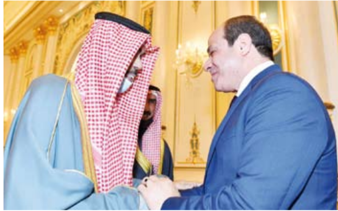
أمير البلاد الراحل الشيخ نواف الأحمد والرئيس المصري عبدالفتاح السيسي