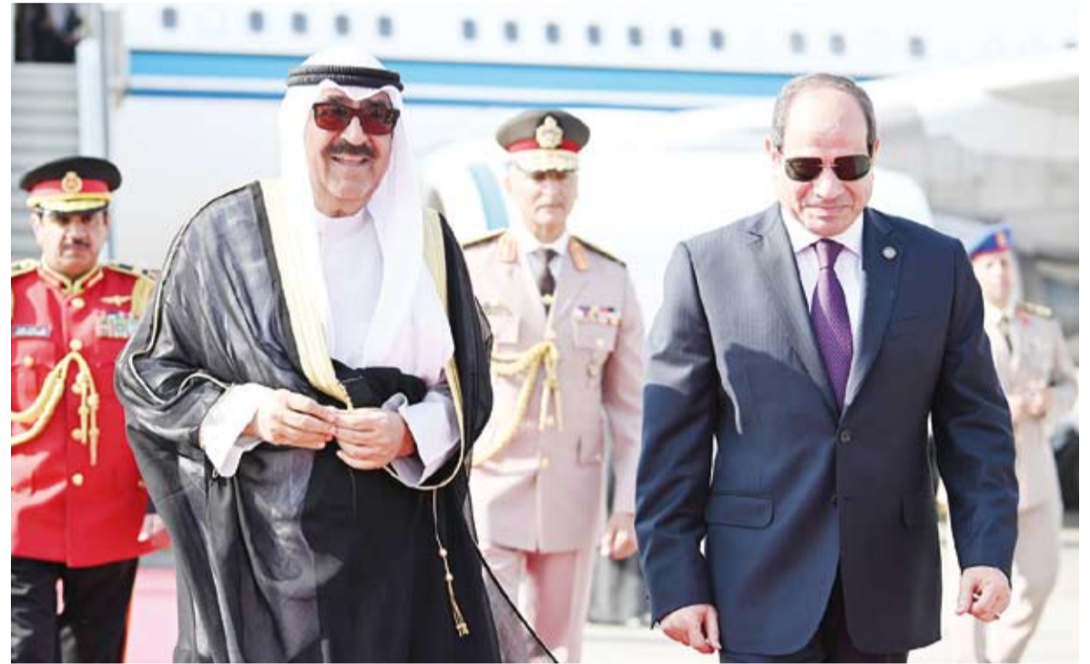
سمو الأمير لدى وصوله إلى جمهورية مصر العربية والرئيس السيسي مستقبلاً سموه بالمطار

يصر رئيس وزراء الاحتلال الصهيوني نتان ياهو على اجتياح رفح سواء قبلت حركة حماس صفقة التبادل ووقف إطلاق النار أم لا، وتأكيد أنه ماضٍ في طريقه لإخلاء المنطقة من السكان، بحجة القضاء على الألوية العسكرية الأربعة الموجودة بالمنطقة الحدودية مع مصر، ونعلم أن ذلك لا يهدف إلا إلى تنفيذ ما تم التخطيط له مسبقاً وهو تهجير أهل القطاع والتخلص من صراع مزمن في رأس الكيان المحتل اسمه «غزة». وموازاة مع ذلك التعتت ذهب الشاب التركي حسن ساكلان إلى القدس قادماً من الأردن بحجة السياحة، لكنه كان عازماً على نيل الشهادة، بعد أن حاول قتل أحد الجنود الصهيينة طعنًا في أحد أروقة القدس... الشعوب تغلي والقادم لا يعلمه إلا الله.