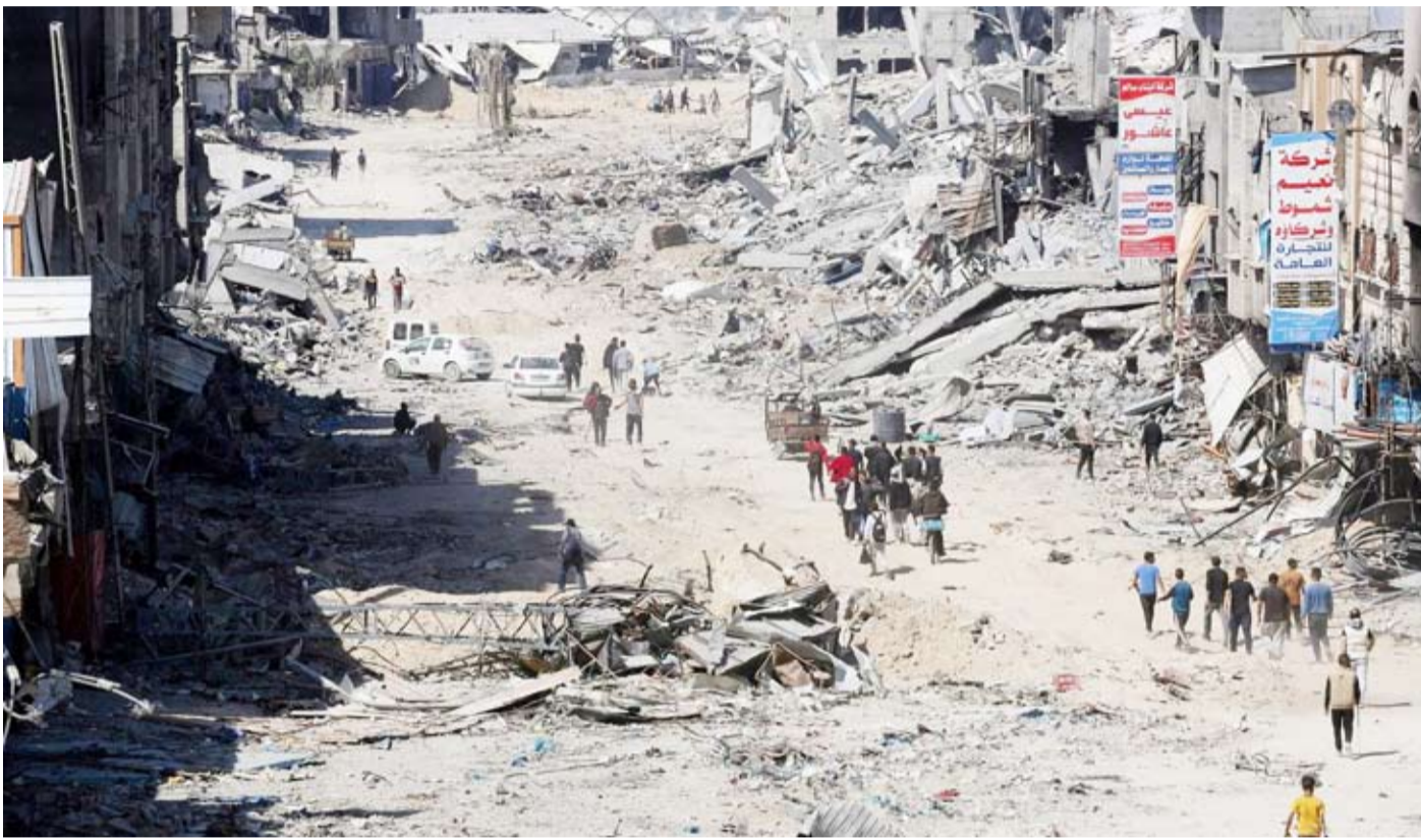
قصف صهيوني متواصل على خان يونس

إطار جولة جديدة في الشرق الأوسط تهدف إلى الدفع باتجاه التوصل إلى هدنة في القطاع الفلسطيني المحاصر والغارق في أزمة إنسانية كبيرة.