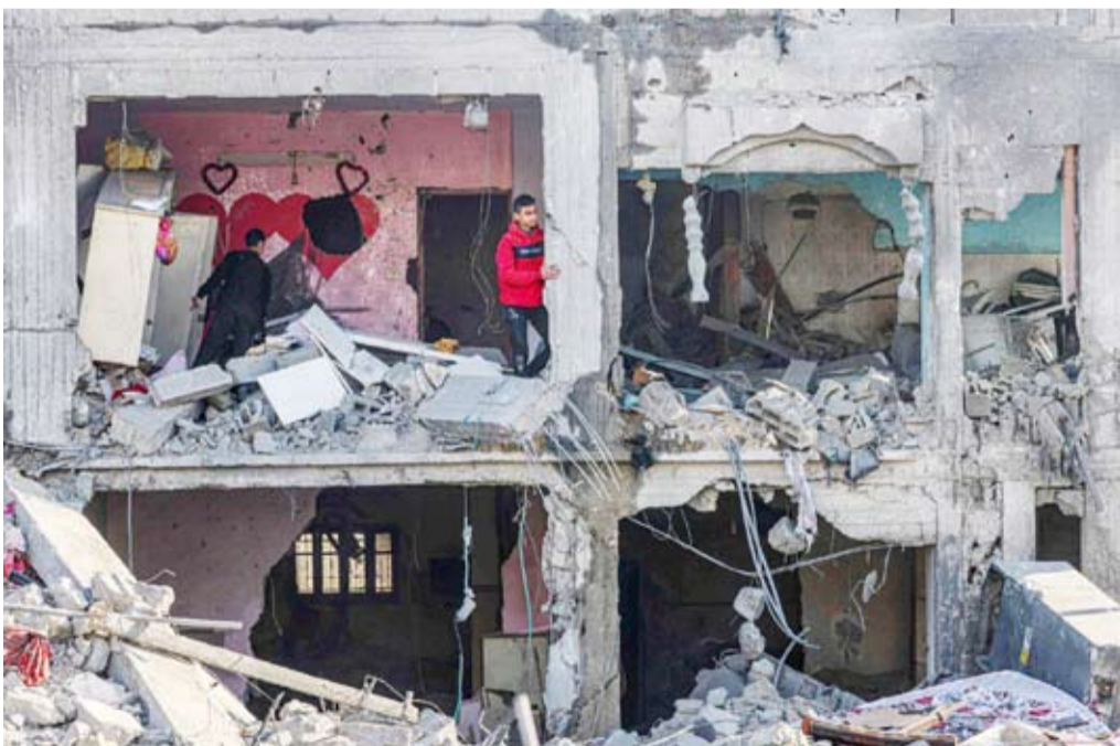
غارت صهيونية متكررة على قطاع غزة

نقلت صحيفة «نيويورك تايمز» عن 3 مسؤولين إسرائيليين القول إن فريق التفاوض الإسرائيلي خفض عدد المحتجزين المقترض إطلاق سراحهم في المرحلة الأولى من الصفقة المنتظرة مع حركة «حماس» لوقف إطلاق النار وتبادل المحتجزين في غزة، وفق ما أورده «وكالة أنباء العالم العربي». وقال المسؤولون الذين لم تسهم الصحيفة، إن إسرائيل تطلب الآن الإفراج عن 33 من المحتجزين بدلاً من 40. وأضافت الصحيفة أن هذه الخطوة تعطي بارقة أمل يقرب التوصل إلى اتفاق لوقف إطلاق النار في غزة. وأشارت إسرائيلياً يخطط للسفر للقاهرة، لاستئناف محادثات وقف إطلاق النار إذا وافقت «حماس» على الحضور أيضاً، وذلك في ضوء المقترح الأخير الذي يدرسه الطرفان. وكان الرئيس الأميركي جو بايدن قد بحث هاتفياً مع كل من الرئيس المصري وأمير قطر، الاتفاق المطروح لإطلاق سراح المحتجزين وإعلان وقف فوري لإطلاق النار في غزة، ودعاهما إلى «بذل كل الجهود لضمان إطلاق سراح المحتجزين في غزة».