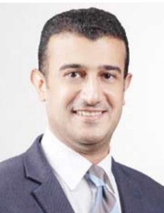
النائب طارق الخولي