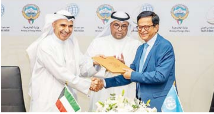
جانب من توقيع مذكرة التفاهم

جراح جابر الأحمد الصباح وبالتنسيق مع معهد الأمم المتحدة للتدريب والبحث (يونيتار). من جهته قال الأمين العام المساعد للأمم المتحدة والمدير التنفيذي لمعهد (يونيتار) نيكيل سيث في تصريح العلاقات بين معهد سعود الناصر الصباح الدبلوماسي ومعهد الأمم المتحدة للبحث والتدريب. وأعرب سيث عن سعادته بالتعاون القائم بين (يونيتار) ومعهد سعود الناصر الصباح الدبلوماسي مشيداً بالعلاقات العميقة مع دولة الكويت في العديد من المجالات المختلفة. يذكر أن معهد سعود الناصر الدبلوماسي وقع مذكرات تفاهم عديدة مع مختلف الجهات تصل إجمالاً عددها إلى 30 مذكرة تفاهم وتعاون مع مختلف المؤسسات والمنظمات الإقليمية والدولية لتعزيز كفاءة وقدرات منتسبي وزارة الخارجية.