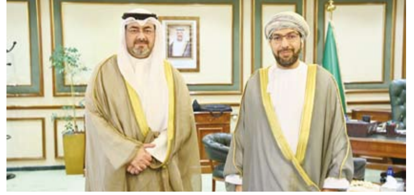
الشيخ عبد الله سالم العلي يستقبل السفير العماني

استقبل محافظ «العاصمة»، الشيخ عبد الله سالم العلي الصباح، في مكتبه بديوان عام المحافظة، صباح أمس، سفير سلطنة عمان الشقيقة لدى دولة الكويت، الدكتور صالح الخروصي، وذلك لتهنئته بمنصبه الجديد، وتمنياته له بالتوفيق والسداد. وأعرب المحافظ عن شكره وتقديره للسفير الخروصي على مشاعره الطيبة متمنياً له دوام الصحة والعافية وللشقيقة عمان وشعبها الكريم دوام الأمن والاستقرار.