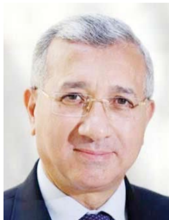
السفير محمد حجازي