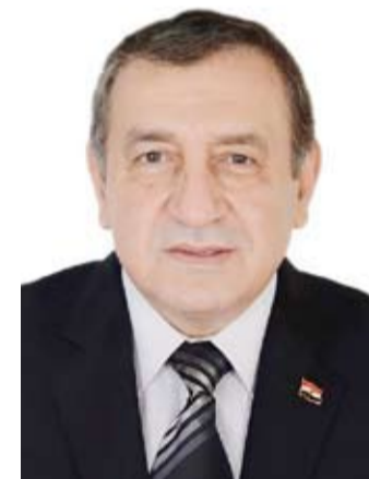
د. عصام شرف

والمتمدة. وتابع: إنه من خلال دور مصر الريادي في المنطقة العربية كان من الضروري أن يكون هناك تبادل لوجهات النظر فيما يتعلق بالقضايا المختلفة وعلى رأسها القضية الفلسطينية وما يتعرض له من محاولات تصفية وما يتعرض له الشعب الفلسطيني من ممارسات متعددة من الإبادة الجماعية. وفيما يتعلق بالعلاقات الكويتية المصرية وصفها بـ "المنيرة للغاية" وأن جذورها ضاربة في التاريخ وداشماً هناك تقارب في وجهات النظر السياسية إزاء القضايا العربية المختلفة. وقال الخولي: إن العلاقات الثنائية المصرية الكويتية "قوية وتشهد ونأماً مستمراً"، مؤكداً أن كل الأنظار تتطلع إلى مزيد من العمل المشترك وزيادة التعاون المنصر.