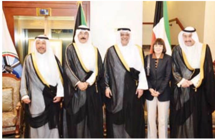
محافظ «الأحمدي» مستقبلاً الشيخ محمد خالد والشيخ فيصل الملك والشيخ غني ناصر العذبي والسفيرة الأميركية

الذين حرصوا على تقديم التهاني، سائلاً المولى أن يحفظ الكويت الحبيبة دار أمن وامان واستقرار ورخاء في ظل قيادة صاحب السمو أمير البلاد الشيخ مشعل الأحمد. وتقدم المهنيين في قصر الضيافة الذي فاض بجموع الأهل والأصدقاء، محافظو العاصمة ومبارك الكبير والغروانية