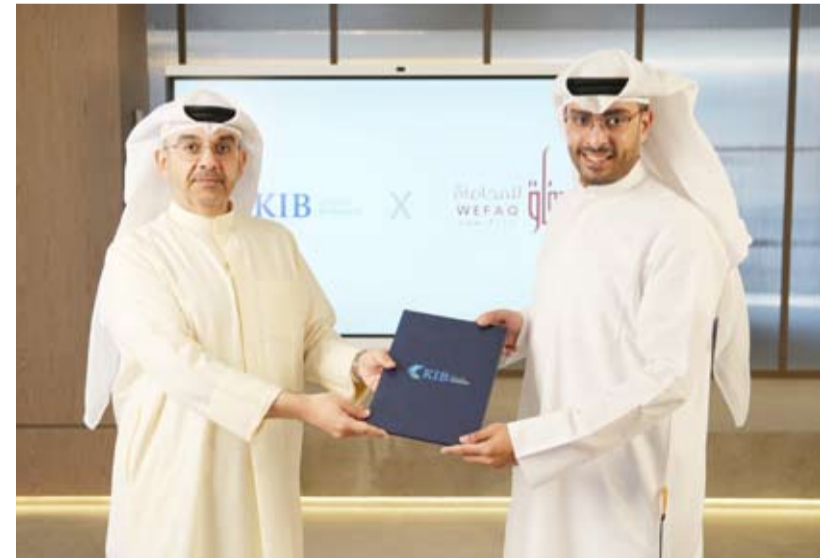
عقب توقيع مذكرة التعاون

أعلنت شركة «KIB مركز مبادر» التابعة لبنك الكويت الدولي (KIB) عن توقيع مذكرة تعاون استراتيجي مع مكتب وفاق للمحاماة والاستشارات القانونية، وذلك بهدف تعزيز التعاون المشترك للوصول إلى تحقيق أهداف مفررة وترسيخ شراكة استراتيجية تدعم تقديم خدمات قانونية متكاملة لأصحاب المشاريع الصغيرة والمتوسطة وتعزيز العمل المشترك من أجل زيادة الدعم للمبادرين ورواد الأعمال في القطاع.