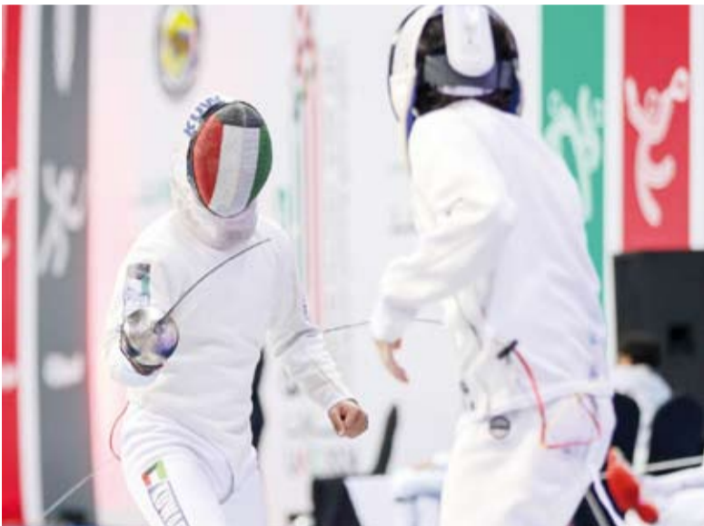
المبارزة بواصل التالف في البطولة