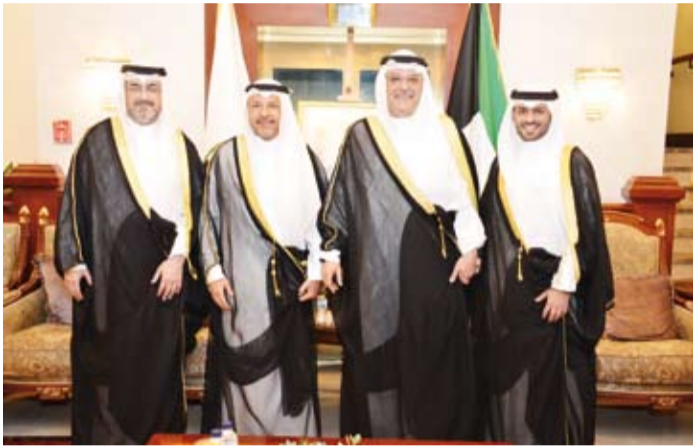
.. ويستقبل محافظي مبارك الكبير والغروانية والعاصمة