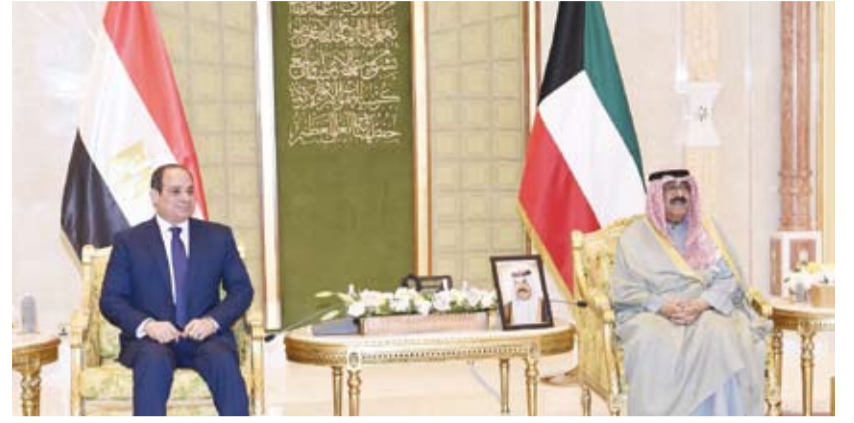
سمو أمير البلاد الشيخ مشعل الأحمد والرئيس المصري عبدالفتاح السيسي