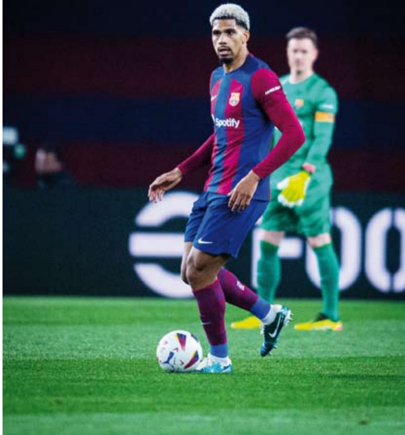
برشلونة على الطريق الصحيح

وعاد برشلونة، الساعي إلى إنهاء الموسم في الوصافة على الأقل من أجل ضمان خوض مسابقة الكأس السوبر الموسم المقبل، إلى سكة الانتصارات بعد خسارته الكلاسيكو أمام غريمه التقليدي ومضيفه ريال مدريد المتصدر 2-3 في الجولة الماضية.