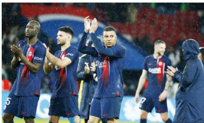
آمال على مبابي في الإبطال بعدما قاد باريس للقب الدوري الإسباني

باريس ميونخ الألماني. ويخوض باريس سان جيرمان