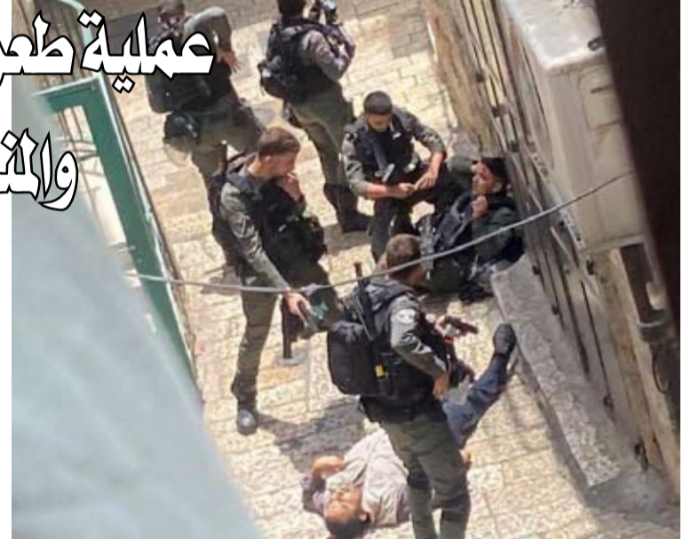
ارتقاء سائح تركي برصاص الاحتلال بعد طعنه شرطياً صهيونياً في القدس

أصيب شاب برصاص قوات الاحتلال في مدينة القدس المحتلة امس بزعم تنفيذ عملية طعن بالقرب من باب الساهرة في البلدة القديمة. وزعمت قوات الاحتلال في بيان أن أحد عناصرها أطلق النار على شاب نفذ عملية طعن أسفرت عن إصابة شرطي بجروح. وذكرت وسائل إعلام الاحتلال أن منفذ عملية الطعن هو مواطن تركي (34 عاماً) تم قتله، مبيته أنه وصل القدس امس الاول عن طريق الأردن.