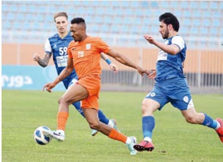
جانب من مباراة كأظمة والشباب

فاز فريق نادي كأظمة لكرة القدم على نظيره الشباب بنتيجة (2-0) في حين تغلب الجھراء على خيطان (4-2) في اختتام مواجهات الجولة 22 (مجموعة الهبوط) من بطولة الدوري الكويتي الممتاز للعبة (دوري زين).