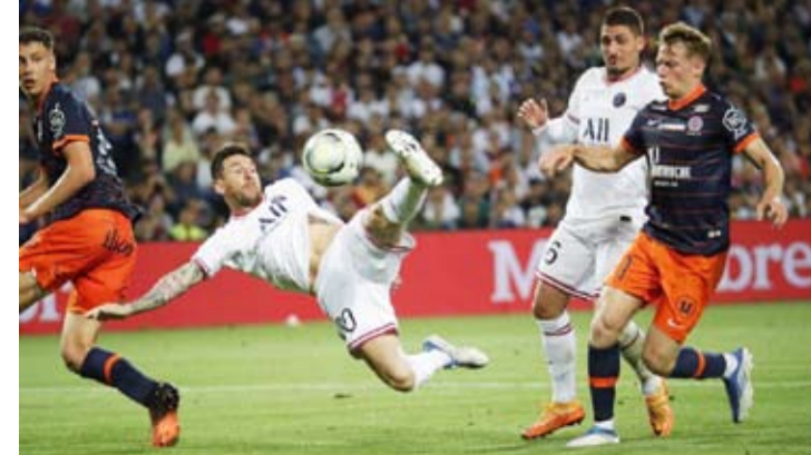
ميسي تالق في اللقاء

وفي مباريات اليوم ضمن الجولة ذاته فاز فريق (مونكو) على (بريست) باربعة اهداف لهدفين ليصعد موناكو للمركز الثاني بـ 68 نقطة فيما هزم فريق (رين) نادي (مارسيليا) بهدفين نظيفين.