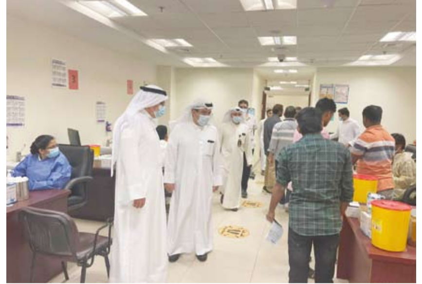
د. خالد السعيد خلال جولته التفقدية