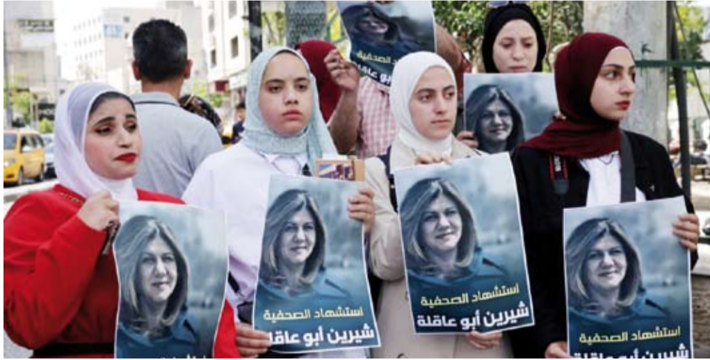
فتيات يحملن صورة أبو عاقلة

الالتزام الفلسطيني الرسمي لإسرائيل. وهو اتهام سعت تل أبيب إلى نفيه منذ البداية، لكنها لم تستطع إثبات عكسه. وطلبت إسرائيل إجراء تحقيق مشترك مع السلطة والحصول على الرصاص التي قتلت أبو عاقلة، لكن السلطة رفضت. واعتبر الشيخ أن ما حصل في تشييع جثمان أبو عاقلة الجمعة، من قبل قوات الشرطة الإسرائيلية «يعزز موقفنا الرافض بمشاركة إسرائيل في هذا التحقيق».