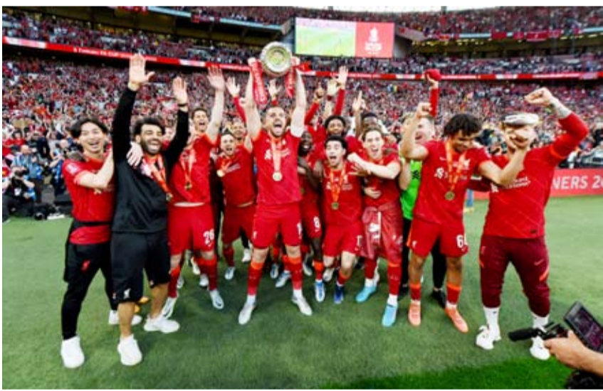
ليفربول يكرس عقدة تشيلسي ويفوز بالكأس

كبير من المشجعين. وقال هندرسون «إنها لحظة مهمة لنا، لم نصل إلى هذا النهائي منذ فترة، لذا الفوز باللقب شيء استثنائي».