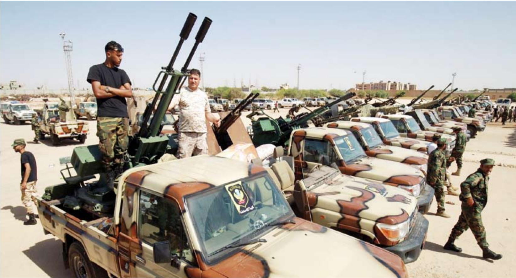
قوات الجيش الليبي

كما اندلعت اشتباكات مسلحة جنوب مدينة بني وليد (180 كيلومتراً جنوب شرقي طرابلس)، عقب اعتقال مسلحين مجهولين لعدد من المواطنين. وقال ناشطون وسكان محليون، إنهم سمعوا قصفاً لما بدا أنه طيران حربي لم تحدد هويته، بينما أشارت وسائل إعلام محلية إلى تصاعد مخاوف المواطنين من ارتفاع وتيرة الاشتباكات بين التشكيلات المسلحة؛ خصوصاً مع إحقاق كل الترتيبات الأمنية والمصالحات الاجتماعية في الحد منها. كما وقعت اشتباكات عنيفة بالأسلحة الخفيفة والمتوسطة بين ميليشيات متنافسة في منطقة دحمان، شرق