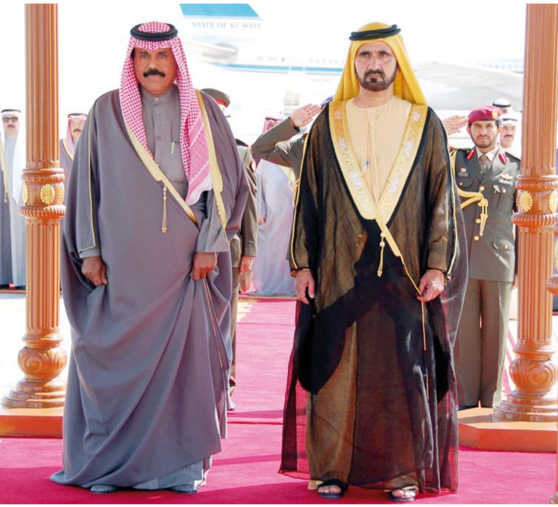
الشيخ محمد بن راشد نائب رئيس الدولة ورئيس الوزراء وحاكم دبي يستقبل سمو أمير البلاد الشيخ نواف الأحمد في زيارة سابقة