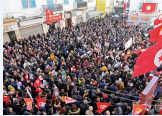
مظاهرات في تونس