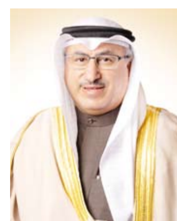
د. محمد الفارس

صرح نائب رئيس مجلس الوزراء وزير النفط لشؤون مجلس الوزراء الدكتور محمد الفارس بما يلي: رحب مجلس الوزراء بانتخاب المجلس الأعلى لاتحاد بدولة الإمارات العربية المتحدة الشقيقة صاحب السمو الشيخ محمد بن زايد آل نهيان رئيساً لدولة الإمارات العربية المتحدة متوها بأن هذا الإجراء يعكس صلابة وتلاحم أعضاء الاتحاد وأبناء الشعب الإماراتي الشقيق بما يجسده من حرص على استمرار النهج الحكيم الذي سار عليه الراحل الشيخ زايد آل نهيان "رحمه الله"، واستمر على خطاه الراحل الشيخ خليفة بن زايد آل نهيان "طيب الله ثراه". كما أكد مجلس الوزراء ثقته الكاملة بقدرة الشيخ محمد بن زايد آل نهيان على مواصلة مسيرة المباركة لدولة الإمارات على طريق التقدم والإزدهار واستكمال دورها البارز بما عرف عن الشيخ محمد بن زايد آل نهيان من حكمة وخبرة والتزام بالقيم والثوابت المدنية الأصيلة التي تميز النهج القويم الذي تسير عليه دولة الإمارات الشقيقة منذ نشأتها.