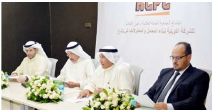
جانب من العمومية

ووافقة وفق استراتيجيتها واضحة المعالم ورؤية مجلس الإدارة، وبجهود فريق عملنا المتكاملة فقد استطاعت تنفيذ جميع الأعمال والمشاريع والأنشطة الموضوعية بكل إخلاص ووفق أعلى مستويات الجودة، حيث كان لخبرة العاملين في جميع الإدارات والأقسام الدور الأبرز في أن تكفل تلك الجهود بالنجاح باعتبارهم العنصر الأعلى. وأبرز تلك الأعمال: توقيع العقد رقم 21056775 مع شركة نفط الكويت والخاص بأعمال خدمات الصرف والجاري ومحطات المعالجة في المناطق الشمالية لعمليات شركة نفط الكويت بقيمة 2,947,062 دينار كويتي. كما تم توقيع العقد رقم 21056717 (تحالف الشركة الكويتية لبناء المعالم