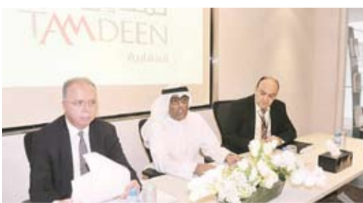
عمومية سابقة للشركة

أظهرت البيانات المالية لشركة التمدين العقارية ارتفاع أرباح الشركة في الربع الأول من العام الجاري بنسبة 45.2 بالمئة على أساس سنوي. بحسب نتائج الشركة للبورصة الكويتية، بلغت أرباح الفترة 3.278 مليون دينار، مقابل أرباح الربع الأول من العام الماضي البالغة 2.257 مليون دينار. وبلغت ربحية سهم الشركة بنهاية الربع الأول من العام الجاري 8.2 فلساً، مقابل ربحية للسهم بقيمة 5.6 فلساً في الفترة المماثلة من العام السابق. وقالت الشركة إن ارتفاع الأرباح خلال فترات المقارنة يعود بشكل أساسي إلى زيادة صافي الإيرادات التشغيلية، وزيادة الأرباح من نتائج شركات زميلة. وبلغ إجمالي الإيرادات التشغيلية للشركة بنهاية الربع الأول من العام الجاري 6.452 مليون دينار، مقابل 5.045 مليون دينار للفترة ذاتها من عام 2021، بارتفاع نسبته 27.9 بالمئة.