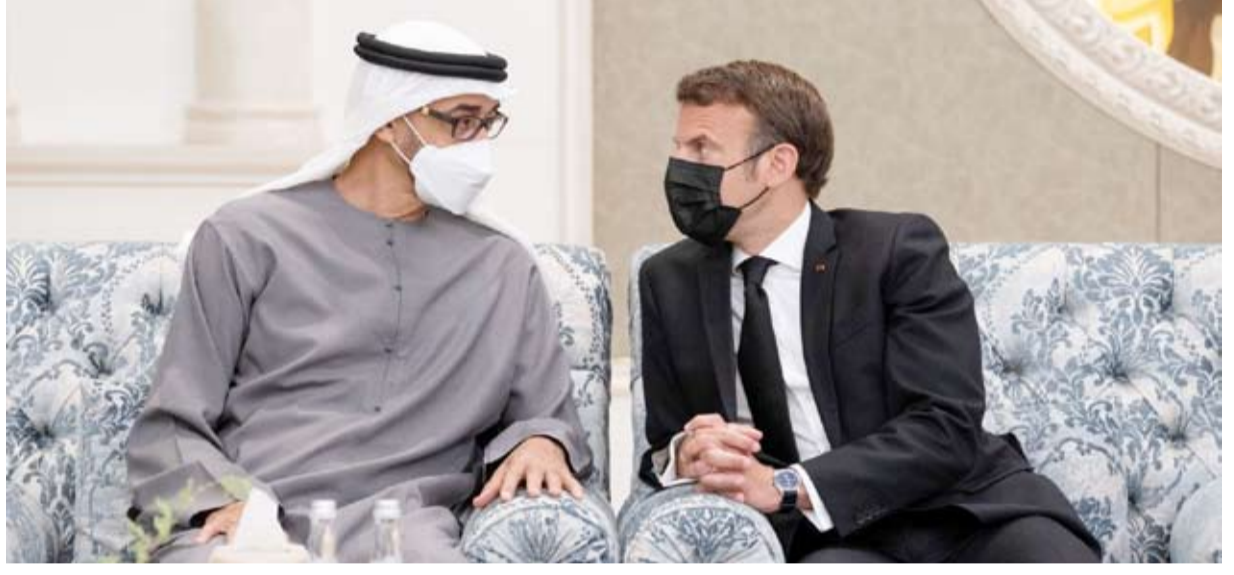
الرئيس الفرنسي إيمانويل ماكرون يعزي رئيس دولة الإمارات الشيخ محمد بن زايد

توافد زعماء العالم، امس الأحد، على دولة الإمارات العربية المتحدة لتقديم التعازي في وفاة رئيس الدولة الشيخ خليفة بن زايد آل نهيان. والتقى الشيخ محمد بن زايد رئيس دولة الإمارات، الرئيس الفرنسي إيمانويل ماكرون. وقدم ماكرون الذي أعيد انتخابه هذا الشهر، تعازيه للشيخ محمد بن زايد، قبل أن يعقدا جلسة مباحثات مغلقة. وأعلن البيت الأبيض، أن نائبة الرئيس الأميركي كامالا هاريس ستترأس وفدًا، امس، لتقديم العزاء. وأوضح أن هاريس ستؤكد لرئيس الإمارات الشيخ محمد بن زايد على متانة الشراكة مع الإمارات ورغبة واشنطن في تقويتها. كما توجه رئيس الوزراء البريطاني بوريس جونسون إلى العاصمة الإماراتية لتقديم العزاء بالشيخ خليفة بن زايد. وقال بيان أصدره مكتب رئيس الوزراء، إن جونسون سيؤكد على ضرورة تعزيز الروابط بين المملكة المتحدة ودولة الإمارات. وكان ولي العهد السعودي الأمير محمد بن سلمان، قد هنا في اتصال هاتفي بالشيخ محمد بن زايد وشعب الإمارات، بمناسبة انتخابه رئيساً لدولة الإمارات العربية المتحدة من قبل المجلس الأعلى للاتحاد، متمنياً له التوفيق ومواصلة مسيرة التنمية، ولدولة الإمارات المزيد من الأمن والرخاء والاستقرار والازدهار. وتوافد قادة عرب واجانب إلى أبوظبي، امس وأمس الأول، لتهنئة الشيخ محمد بن زايد بانتخابه رئيساً للإمارات