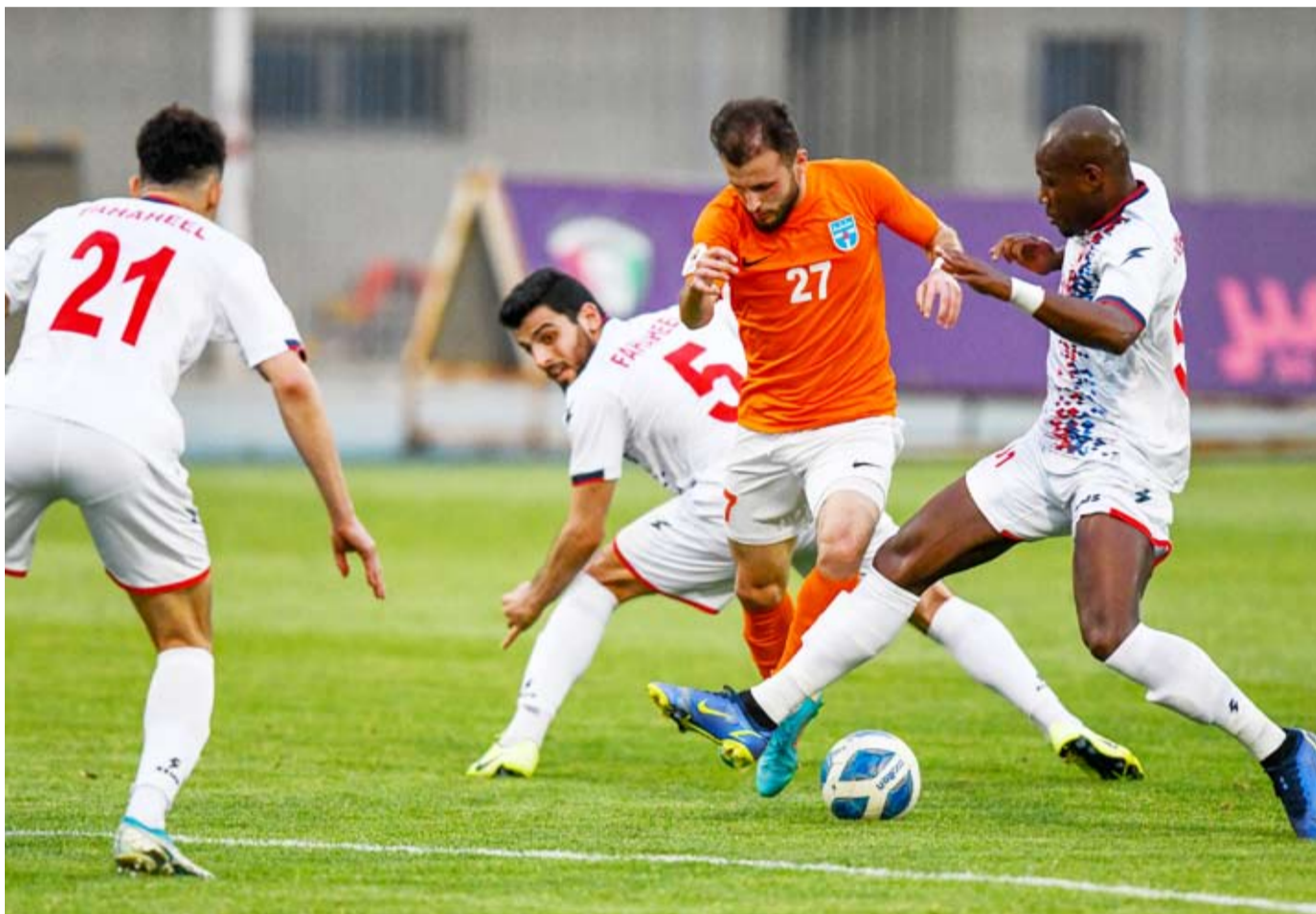
النسخة 60 من كأس سمو الأمير بين كاظمة والسالمية

لقب البطولة سبع مرات وأحرز كل من السالمية واليرموك اللقب مرتين ونادي الفحيحيل مرة واحدة.