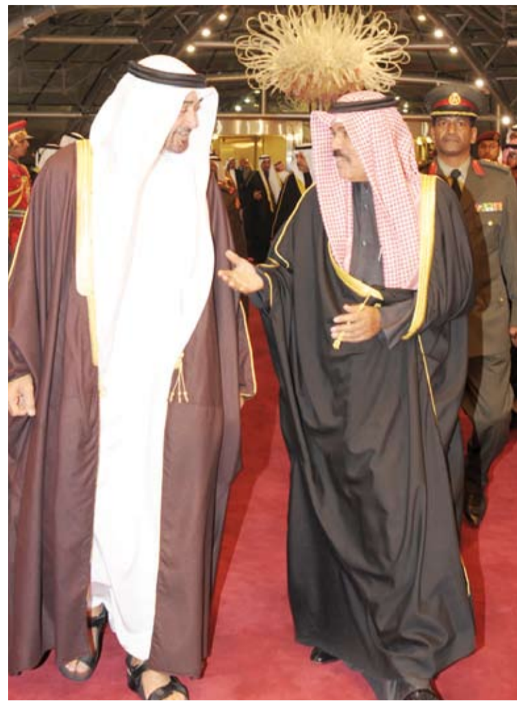
سمو أمير البلاد الشيخ نواف الأحمد يستقبل سمو الشيخ محمد بن زايد آل نهيان في لقاء سابق

ترتبط دولة الكويت بعلاقات أخوية وثيقة مع شقيقتها دولة الإمارات العربية المتحدة تمتد في أعماق التاريخ وطورها حرص القيادات الحكيمة في البلدين طوال العقود الماضية على تعزيزها وتطويرها في كل المجالات.