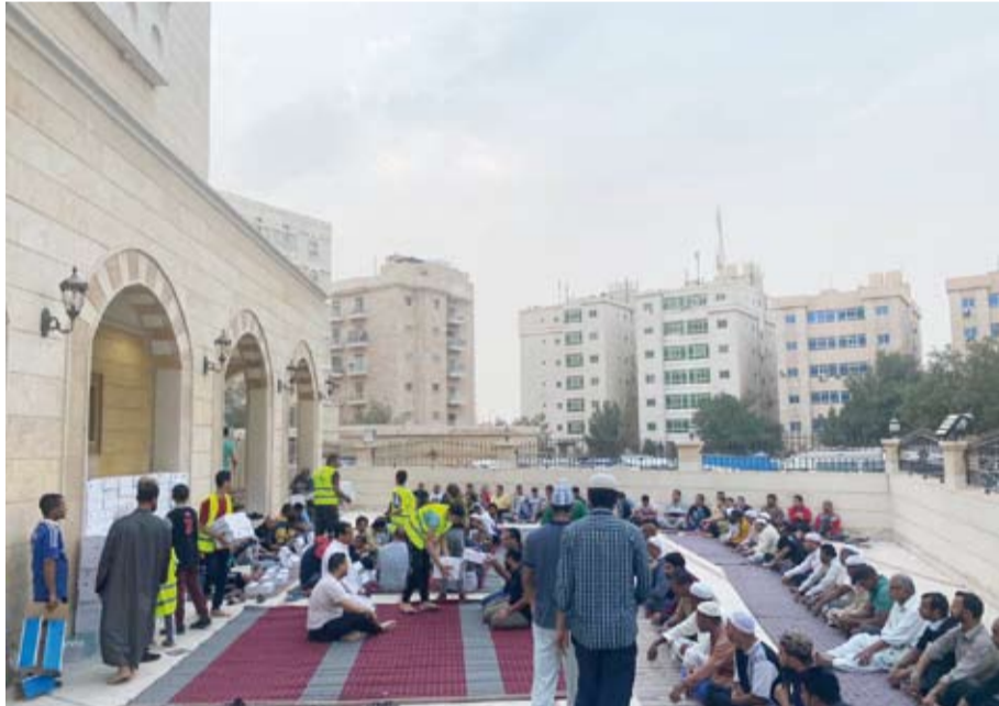
مشروع إفطار الصائم

خلال رمضان، مبيئاً أن بلد الخير تمتلك فريقاً متكاملًا لإدارة العمل الخيري واستقبال الأسر المتعففة بهدف تلبية جميع متطلباتهم والعمل على حل مشاكلهم.