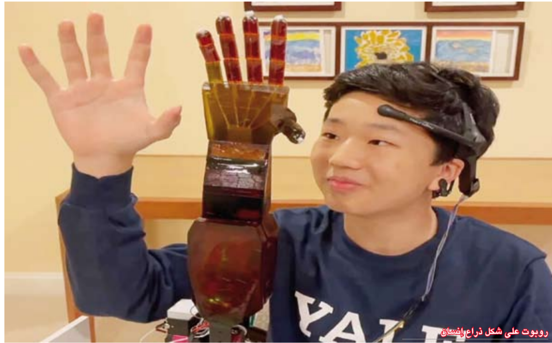
روبوت على شكل ذراع إنسان

عبر البلوتوث إلى الذراع الآلية "فتطيع". وساعده في تجربة الجهاز 6 منظوعين، حيث سجل المهندس الشاب إشارات دماغهم وقارنها بكيفية تفاعل أيديهم. وعلى سبيل المثال هل تكون القبضة مشدودة أو غير مشدودة، وبالتالي، كان من الممكن "تعليم" الذراع للاستجابة بشكل صحيح. وتم تنفيذ ما يقارب 100% من الأوامر الذهبية. وفي الوقت نفسه، تبلغ تكلفة الجهاز 300 دولار فقط، أما النماذج التجارية في السوق فسعرها لا يقل عن عشرة آلاف دولار ولا تعمل بشكل مطلوب.