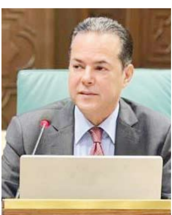
المستشار فلاح المطيري

أعرب نائب مندوب الكويت لدى جامعة الدول العربية، أمس، المستشار فلاح المطيري، عن التعازي الإمارات لشعب دولة الإمارات والشعوب العربية والإسلامية في وفاة رئيس دولة الإمارات الشيخ خليفة بن زايد. وقال المطيري في اجتماع مجلس الجامعة العربية على مستوى المندوبين الدائمين لتأبين الشيخ خليفة بن زايد: إن الراحل تميزت مسيرته الحافلة في إيماء وازدهار الإمارات وتحقيق الاستقرار في منقلبنا العربية.