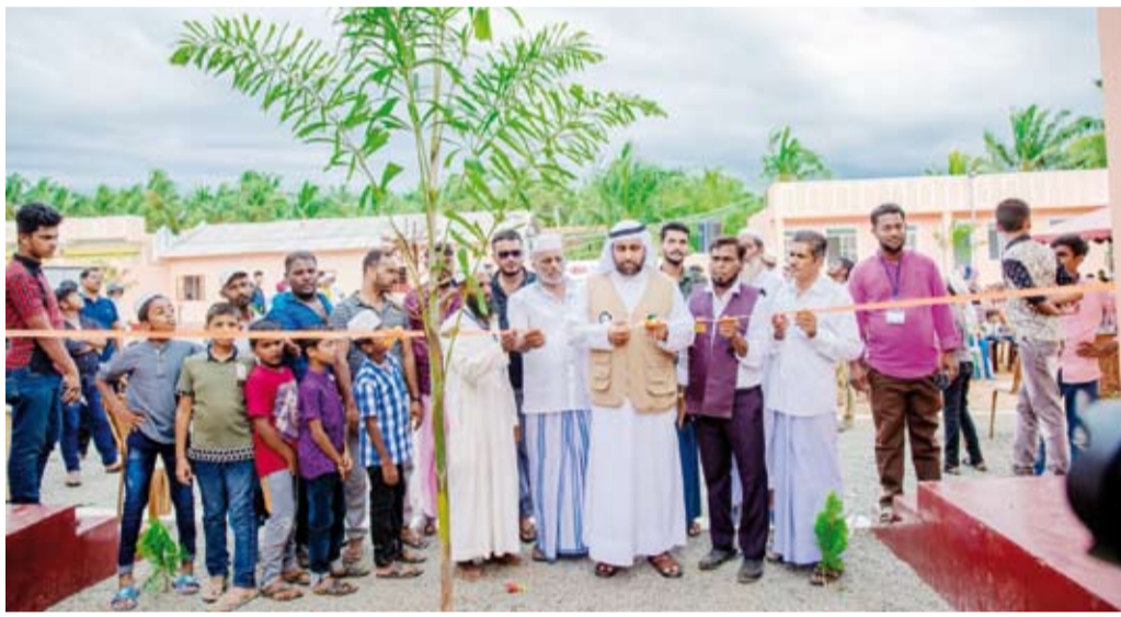
افتتاح دار للإيتام

وقال الشهاب: إن أهداف الجمعية تتمثل في تنمية المجتمعات الإسلامية في الجوانب الحضارية (الدعوية والتعليمية والصحية) وأهليهم ومجتمعهم وبلدهم. موصفاً: يأتي ذلك من خلال رسالتها الهادفة إلى الريادة لأعمال الخيرية والإنسانية التنموية، وأن تكون الخيار الأول للمحسنين والداعمين واحترافية الوقف والاستثمار لتنفيذ برامجها ومشروعاتها لتنمية المجتمعات من خلال القوى البشرية المؤهلة والتحالفات الاستراتيجية وفقاً للمعايير المؤسسية والمهنية.