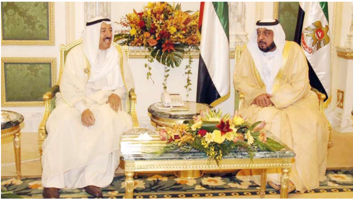
سمو أمير البلاد الراحل الشيخ صباح الأحمد خلال لقاء سابق مع سمو الشيخ خليفة بن زايد "رحمه الله"

وساهمت دولة الكويت مالياً وإدارياً في تقديم تلك الخدمات والإشراف عليها