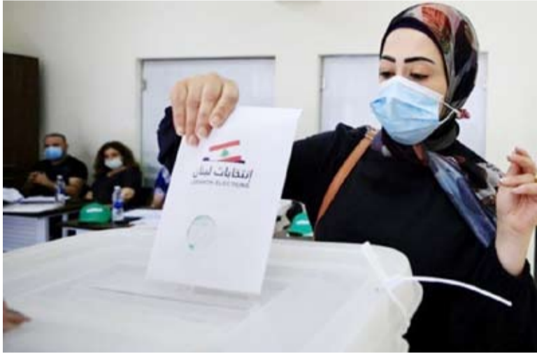
أحدى اللبنانيات تدلي بصوتها وسط توترات خارجية

لم تسجل مراكز الاقتراع في لبنان إقبالا كثيفا حتى الساعة الثالثة عصر من امس ، وأعلنت وزارة الداخلية، أن نسبة الاقتراع بلغت 25.26 في المئة قبل أربع ساعات من إغلاق الصناديق. وقد توجه الناخبون اللبنانيون عند الساعة من صباح امس إلى صناديق الاقتراع في جميع المناطق اللبنانية لاختيار 128 نائباً يشكلون البرلمان للأربع سنوات المقبلة وسط إجراءات أمنية مشددة. وأدى رئيس مجلس الوزراء نجيب ميقاتي بصوته في مدينة «طرابلس» شمالاً. قائلًا «أن الدولة بكل أجهزتها مستعدة لانجاز هذا الاستحقاق الديمقراطي»، وأنها استعدت لهذا الاستحقاق وجندت 100 ألف عنصر. ويبلغ مجموع الناخبين بحسب وزارة الداخلية ثلاثة ملايين و746 ألفاً و483 موزعين على 15 دائرة انتخابية سيقترعون للوائح الانتخابية موزعة على الشكل التالي بيروت «داشرتان» بيروت الأولى 6 لوائح وبيروت الثانية 9 لوائح.