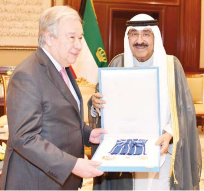
سمو أمير البلاد يمنح العام للأمم المتحدة وسام الكويت ذو الشواح من الدرجة الممتازة