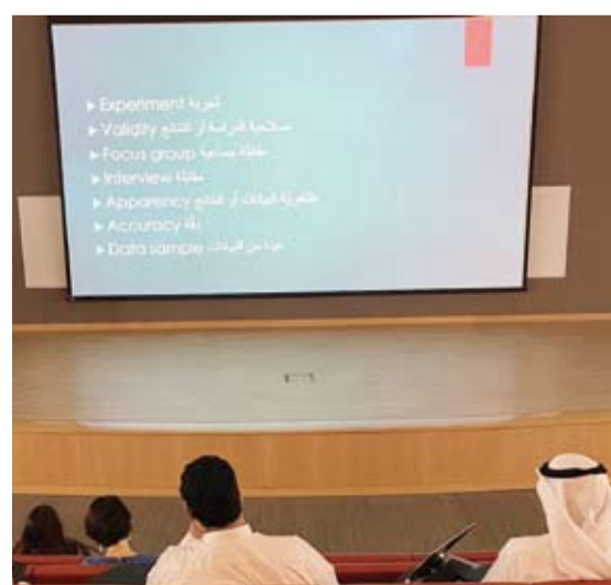
جانب من ورشة العمل

ترجمة الملخص البحثي من الإنجليزية إلى العربية في الأطروحات وبسبب النقل الخاطي في ترجمة المصطلحات التقنية والأكاديمية.