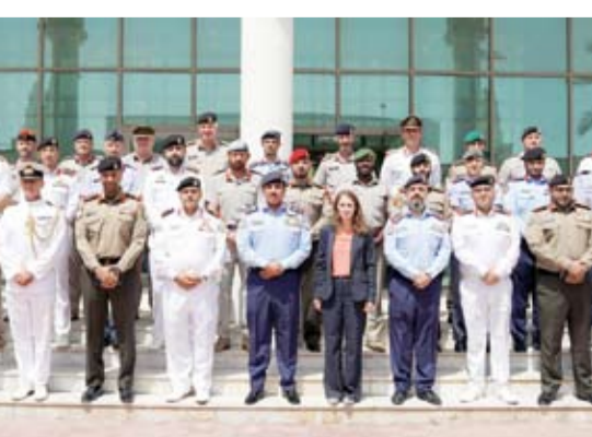
سفيرة المملكة المتحدة مع قيادات كلية مبارك العبدالله

أكد سفير دولة الكويت لدى سلطنة عُمان، الدكتور محمد الهاجري، أمس، عمق العلاقات الكويتية - العمانية المتصلة والروابط الأخوية التي تجمع البلدين الشقيقتين، إذ تميزت بخصوصية متفردة على المستويين الرسمي والشعبي. وقال السفير الهاجري لـ (كونا) بمناسبة زيارة دولة التي سيقوم بها صاحب الجلالة السلطان هيثم بن طارق بن تيمور آل سعيد المعظم - سلطان عمان إلى دولة الكويت، اليوم الاثنين: إن العلاقات بين البلدين الشقيقتين تشهد نمواً وتطوراً مستمراً على جميع المستويات التي عزز من رسوخها اهتمام الجانبين بالمضي بها قدماً. وأفاد بأن هذه الزيارة تكتسب أهمية كبيرة في دفع العلاقات الثنائية بين الكويت وسلطنة عُمان إلى مزيد من التقدم والرخاء والأزدهار لتحقيق أهداف وتطلعات القيادتين والشعبين الشقيقتين. وذكر أن الروابط الوثيقة والقوية بين