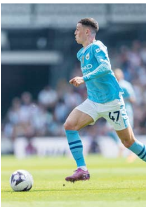
الفني الذهبي لسيتي فيليب فودين

اعتلى مانشستر سيتي صدارة جدول ترتيب الدوري الإنجليزي الممتاز لكرة القدم بشكل مؤقت بفضل فوزه الحثيث على