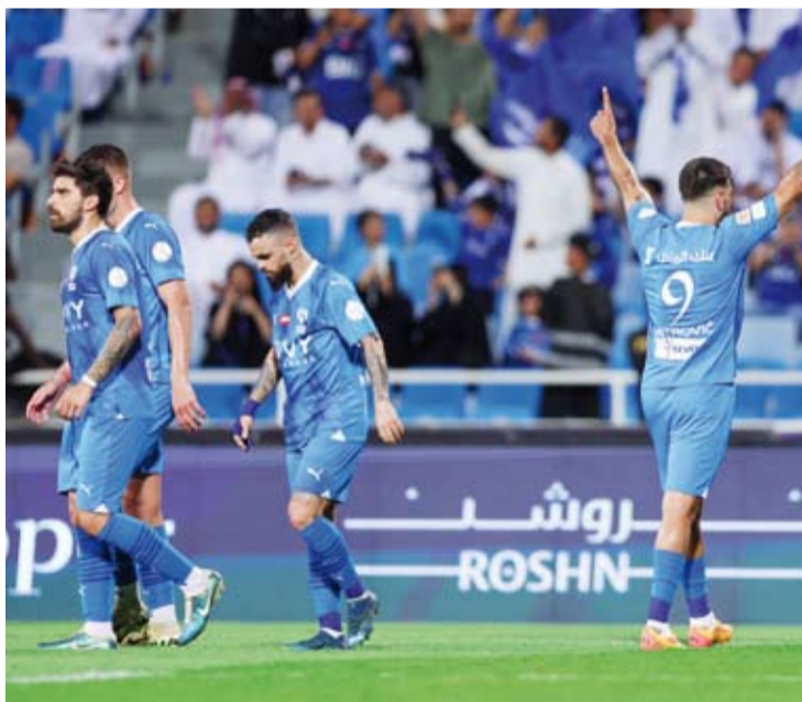
الهلال يحسم اللقب قبل 3 جولات من النهاية