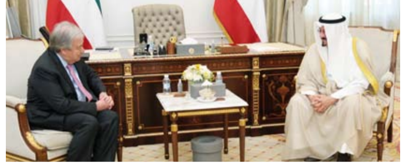
الشيخ أحمد العبدالله يستقبل أنطونيو غوتيريش

استقبل الشيخ أحمد العبدالله رئيس مجلس الوزراء المكلف بتشكيل الحكومة، وبحضور وزير الخارجية عبدالله الجبير، في قصر بيان، الأمين العام للأمم المتحدة أنطونيو غوتيريش والوفد المرافق له وذلك بمناسبة زيارته للبلاد. وجرى خلال اللقاء بحث أوجه التعاون بين دولة الكويت والأمم المتحدة وأجهزتها المختلفة إضافة إلى آخر المستجدات على الساحتين الإقليمية والدولية وسبل دعم جهود المنظمة لإرساء دعائم السلم والأمن في المنطقة والعالم.