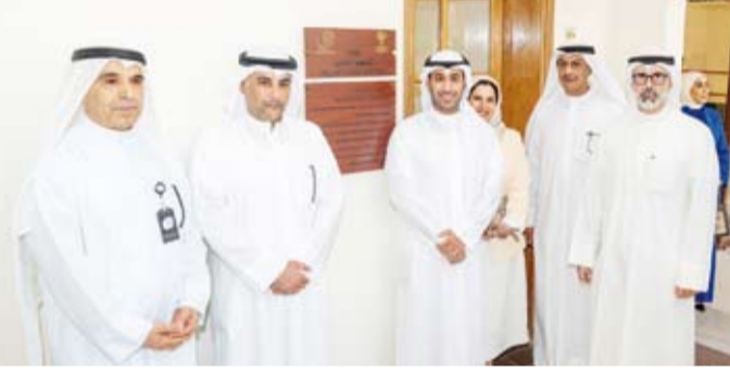
نائب وزير الخارجية السفير الشيخ جابر الأحمد يفتتح قاعة الشهيد السفير مصطفى المرزوق

أعلن مساعد وزير الخارجية لشؤون معهد سعود الناصر الصباح الدبلوماسي، السفير ناصر الصباح، أمس، اعتماد الـ 12 من مايو من كل عام يوماً للدبلوماسية الكويتية لتوافق مع تاريخ اعتماد الرسوم بقانون إنشاء وزارة الخارجية وتنظيم العمل بالوزارة.