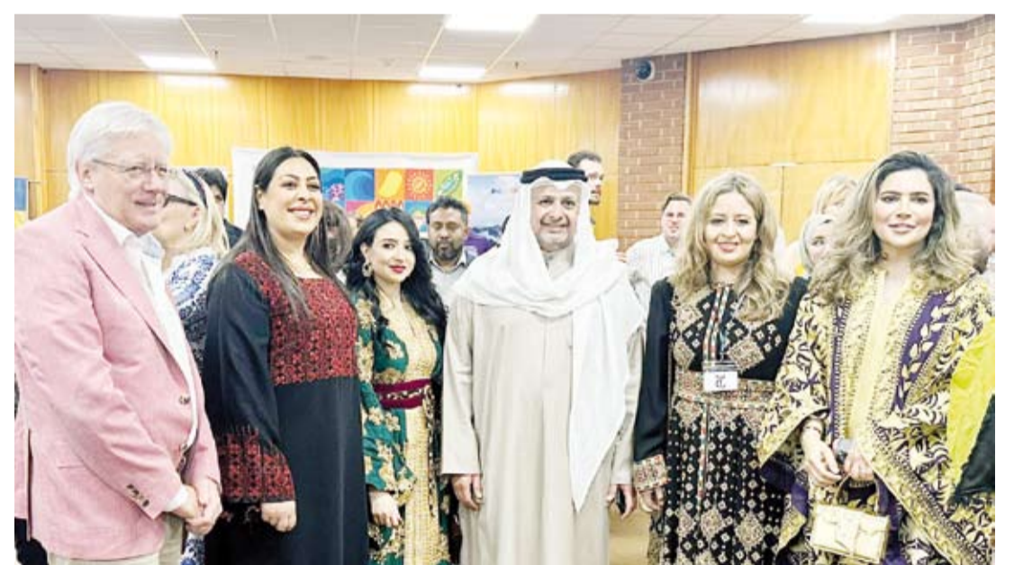
سفير الكويت بدر العوضي والحضور خلال الحفل الخيري

وأشارت السفارة إلى أن السفير العوضي أعرب عن فخره وسعادته باستضافة ورعاية هذا الحدث الذي ينطوي على إبعاد خيرية وإنسانية سامية فضلاً عن كونه مناسبة ثقافية مميزة تجمع ثقافات متعددة تحت سقف واحد لهدف نبيل. وأوضحت أن السفير العوضي شدد على أهمية الثقافة في نشر مبادئ التفاهم والحوار وتقريب الشعوب إلى بعضها، معتبراً أن الثقافة تعد أحد الجسور المهمة التي يجب التركيز عليها لتعزيز القيم الإنسانية حول العالم. من جانبها أشادت عمدة (كينزينغتون) وتشيلسي) بريتي هاد في كلمة مماثلة باستضافة سفارة دولة الكويت لهذا الحدث الثقافي الذي يعد الأول من نوعه في بريطانيا وحرص السفير العوضي على الحضور شخصياً. وأكدت العمدة هاد ما ذكره السفير