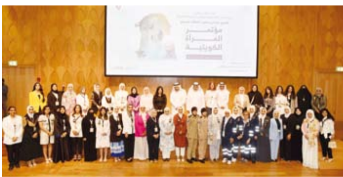
لقطة جماعية لعدد من المشاركين في افتتاح المؤتمر

نسبتين نحو 51% في العام 2024. وأضاف أن المرأة الكويتية أحرزت تقدماً نوعياً ملموساً في معدلات المساهمة في النشاط الاقتصادي وسوق العمل، حيث إن المرأة الكويتية تمثل (58%) مقارنة بنسبة (42%) للرجال من إجمالي وتمكينها في المجتمع. والقّت رئيسة مكتب اليونسيف في الخليج تاتيانا كولن كلمة قالت فيها: نجتمع هنا بدعم من الأمم المتحدة لهذا المؤتمر المحوري للمرأة الكويتية، فإننا لا نناقش تمكين المرأة فحسب - بل نحفل به كأساس لنمو المجتمع وازدهاره واستدامته في المستقبل ن مضيفة إن تمكين المرأة يتجاوز مجرد تحقيق المساواة، بل يتعلق ببناء مجتمع أقوى فالمرأة غالباً ما تكون المرأة قلب الأسرة، وتشكل جيلنا القادم. وأضافت: كممثلة لليونسيف، شهدت بنفسى مدى أهمية دور المرأة كمرربة وقائدة في عائلتنا ومجتمعاتنا، ومن خلال منحهم إمكانية الوصول إلى التعليم والرعاية الصحية والفرص الاقتصادية، فإننا لا نغير حياة الأفراد، بل نهدد الطريق أيضاً لأجيال مستقبلية أكثر صحة وأكثر مرونة، مضيفة أن هذا استثمار في مستقبل أكثر إشراقاً وأكثر أملاً للجميع.