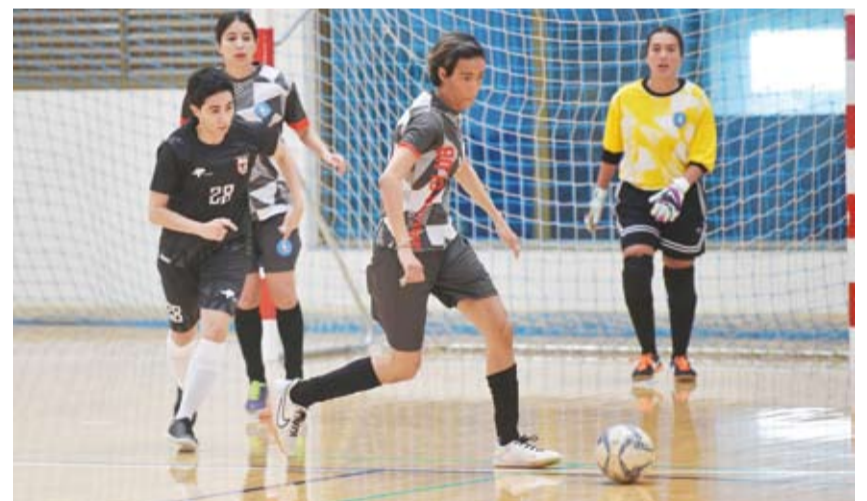
جانب من مباراة فتيات العيون وسلوى الصباح

وحقق نادي الفتاة لكرة قدم الصالات للسيدات فوزاً كبيراً على نظيره برقان في أولى مباريات دوري كي تك بنتيجة (10-0). ففي المباراة الأولى التي أقيمت اليوم السبت على صالة نادي الفتاة الرياضي تمكن نادي الفتاة من احراز فوز صريح على منافسه بـ10 أهداف بعد أن قدمت اللاعبات مستوى متميزاً هجوماً ودفاعاً بفضل تالق لاعباته. وفي المباراة الثانية فاز نادي فتيات العيون على خصمه نادي سلوى الصباح بنتيجة (3-1) ولعب كلا الفريقين بقوة وحماس لتحقيق الفوز.