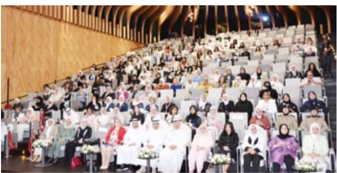
جانب من الجلسة الافتتاحية للمؤتمر