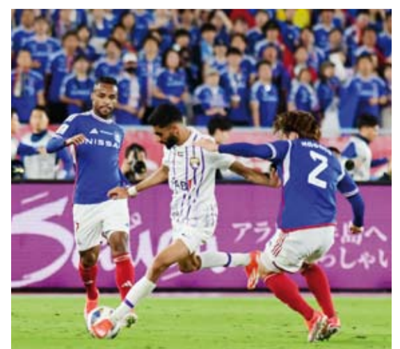
العين لم يحافظ على هدف التقدم

سجل يوكوهاما مارينوس الياباني هدفين في الشوط الثاني ليقلب تأخره لفوز 2-1 على ضيفه العين الإماراتي في ذهاب نهائي دوري أبطال آسيا لكرة القدم.