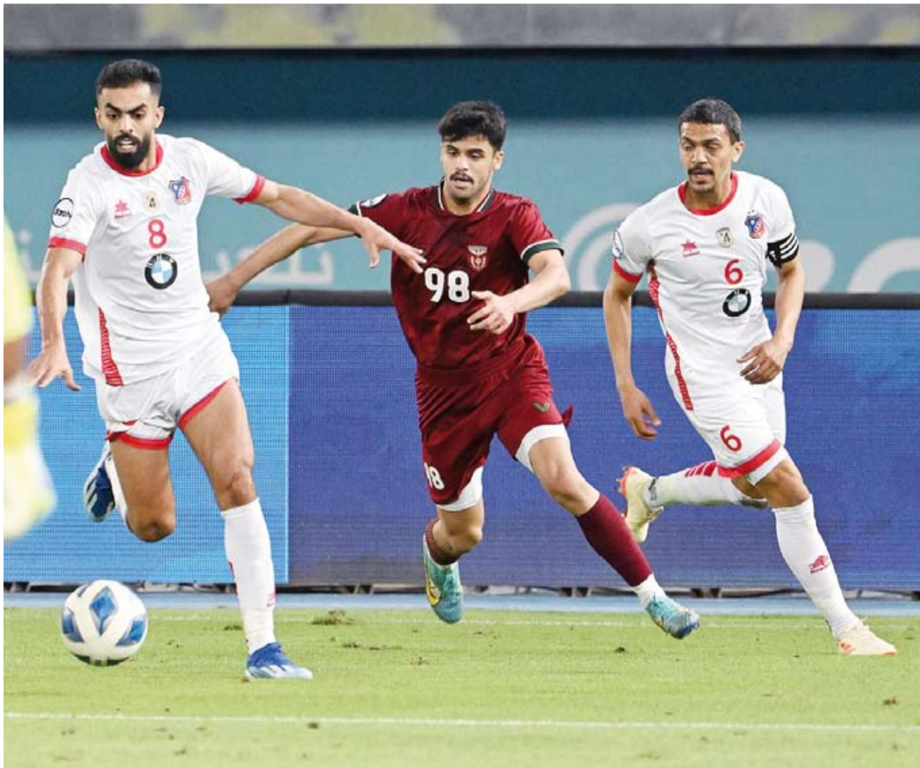
الكويت يقسو على النصر بالخمسية