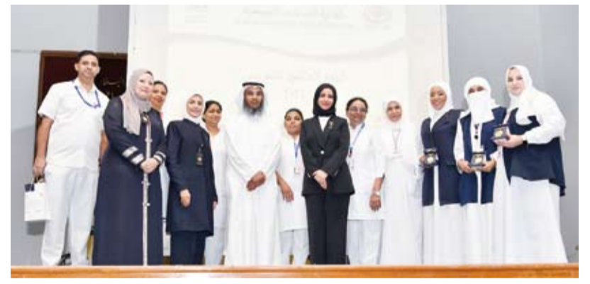
وكيل وزارة الصحة د. عبدالرحمن المطيري متوسطاً عدداً من المربين

وقالت العوضي: إن شعار هذا العام (مروضونا.. مستقبلينا - القوة الاقتصادية للرعاية) يمثل دعوة إلى الاستثمار بالتمريض من خلال التدريب المستمر مؤكدة حرص إدارة الخدمات التمريضية على مشاركة المجتمع بدورها في تطوير مهارات الممرضين العاملين بمهنة التمريض. وأوضحت أن الهيئة التمريضية تشكل العدد الأكبر من القوة البشرية العاملة في الرعاية الصحية مشيرة إلى أن الاحتفال باليوم العالمي يهدف إلى تقدير الكوادر التمريضية على الجهود والمبادرات المحذولة من أجل تقديم الرعاية والرعاية والتوعية الصحية لكل أفراد المجتمع. وذكرت أن الكويت تشهد تطوراً ملحوظاً متقدماً في مجال الرعاية الصحية وأن أعداد الهيئات التمريضية في المستشفيات والمراكز الصحية تتخطى 22 ألف ممرض وممرضة يتم تدريبهم على أعلى مستوى.