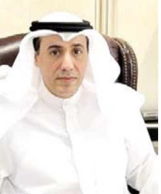
سفير الكويت لدى سلطنة عُمان د. محمد الهاجري

العلاقات بين الدول، إذ تعززت بالعديد من القواسم المشتركة مثل النهج الدبلوماسي المتبع القائم على الحكمة وحسن الجوار واحترام سيادة الدول. ونوه السفير الهاجري بالإرث التاريخي والاجتماعي الذي أوجد طابعاً غير تقليدي للعلاقات الرسمية والشعبية بين البلدين الشقيقتين وحرص القيادتين السياسيتين على تطويرها وتنميتها في مختلف المجالات. وذكر أن العلاقات الثنائية الرسمية بين البلدين شهدت تطوراً ملحوظاً منذ بزوغ فجر النهضة الحديثة في سلطنة عمان بقيادة السلطان قابوس بن سعيد (طيب الله فراه) الذي ارتبط بعلاقات أخوية وثيقة مع إخوانه قادة الكويت ما أكسب تلك العلاقات تميزاً نوعياً شهدت خلاله تفاعلات مفصلة أثمرت عن اتفاق رغبة من التعاون والتكامل في إطار البيت الخليجي الواحد.