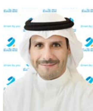
الشيخ عبد الله ناصر الصباح

منهجية حكيمة لإدارة المخاطر وذلك لتحقيق قيمة ملموسة لمساهمين الكرام."