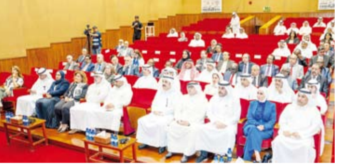
جانب من حضور ندوة يوم الدبلوماسية الكويتية