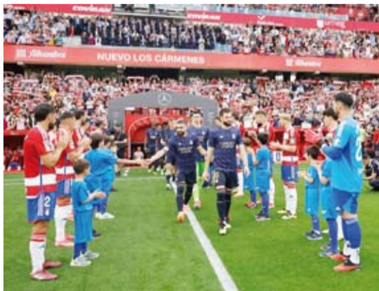
ممر شرقي لأبطال الليغا

احتفل نادي ريال مدريد بالتتويج بلقب الدوري الإسباني لكرة القدم من خلال الانتصار الساحق على مضيفه غرناطة 4-0 صفر في المرحلة السادسة والثلاثين. وكان النادي الملكي توج الأسبوع الماضي بلقب الدوري الإسباني للمرة الـ36 في تاريخه قبل أن يسجل الانتصار الثامن والعشرين مقابل ستة تعادلات وهزيمة واحدة، ويمتلك أقوى خط هجوم حيث سجل 78 هدفاً كما يمتلك أقوى خط دفاع إذ اهتزت شبكته 22 مرة. وحسم ريال مدريد الفوز بهدفين في كل شوط، إذ انتهى الشوط الأول بتقدمه بهدفين نظيفين أحرزهما فران غارسيا والتركي أردا توران في الدقيقتين 38 و45. وفي الشوط الثاني تالق المغربي براهيم دياز بشكل لافت وسجل الهدفين الثالث والرابع للنادي الملكي في الدقيقتين 49 و58. ورفع ريال مدريد رصيده في الصدارة إلى 90 نقطة وتوقف رصيد غرناطة عند 21 نقطة، إذ هبط الفريق رسمياً للدرجة الثانية رفقة أليريا.