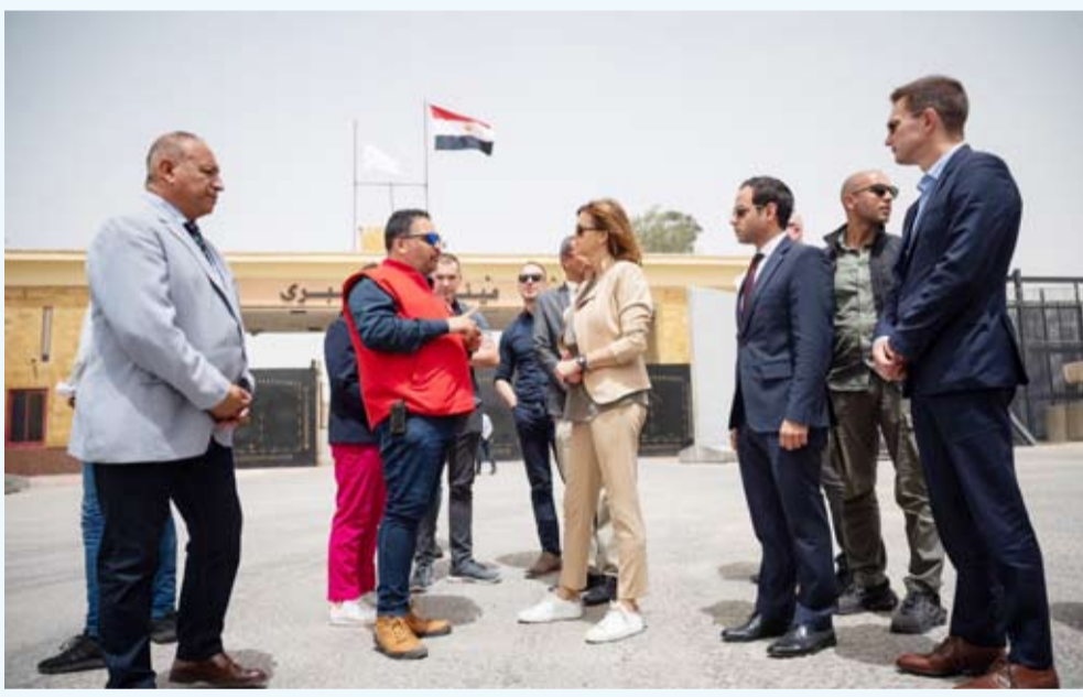
وزيرة خارجية سلوفينيا أمام معبر رفح

وإسرائيل إلى إيداء «مرونة» من أجل التوصل «في أسرع وقت» إلى هدنة في غزة تتيج أيضاً إطلاق سراح محتجزين في القطاع الفلسطيني منذ نهاية يناير الماضي يسعى الوسطاء من مصر وقطر والولايات المتحدة إلى الوصول لهدنة في قطاع غزة، وعمدت جولات مفاوضات ماراتونية غير مباشرة في باريس والقاهرة والدوحة، لم تسفر حتى الآن عن اتفاق، وسيق أن أسفرت وساطة مصرية - قطرية عن هدنة لمدة أسبوع في نوفمبر الماضي، تم خلالها تبادل محتجزين من الجانبين.