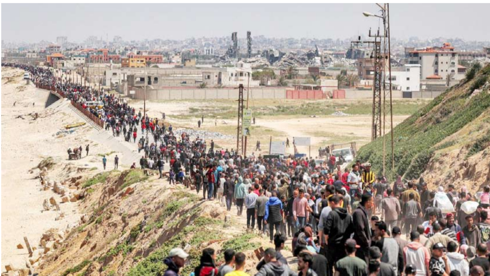
النازحون الفلسطينيون يحاولون العودة إلى شمال قطاع غزة

بينما تتخفف مصر من اتصالاتها وتحركاتها الدبلوماسية التحذير من «خطورة المخطط الإسرائيلي على مدينة رفح الفلسطينية»، دعت إسرائيل الفلسطينيين إلى «إخلاء بعض المناطق برفح، إيداناً ببدء عملية عسكرية نوعية على المدينة».